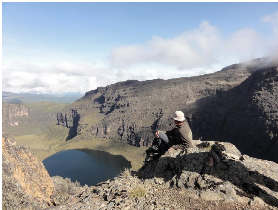
Le Lac Michaelson n'est qu'une des vues à couper le souffle en redescendant.