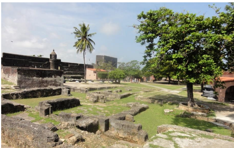
Fort Jesus à Mombasa : vestige colonial, mais aussi tropical.

Déjà 10 jours que j'ai quitté Nairobi ! Deux nuits en moyenne au même endroit font de mon voyage une sorte de papillonnage de ville en ville. Mon périple a commencé par le train flambant neuf (2017) et pile à l'heure reliant Mombasa. Toute la côte est chaude et humide, avec l'apogée de mes transpirations à Zanzibar, mais il n'y a pas eu une goutte de pluie jusqu'à aujourd'hui ; à se demander pourquoi j'ai pris mon imperméable ;)