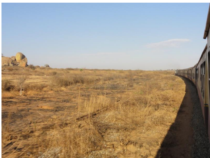
Notre train solitaire parcourt les savanes tanzaniennes.

De retour à Dar le 11 novembre, 100 ème anniversaire de l'armistice 14-18, j'ai été témoin d'une procession de voitures diplomatiques européennes vers le monument des Askari, ces soldats des colonies tombés sous le drapeau des puissances coloniales. Puis j'ai quitté Dar en train, un autre vestige colonial, pour m'enfoncer dans l'arrière-pays tanzanien. Hors des zones touristiques, je n'aurai vu que trois personnes blanches en quatre jours !