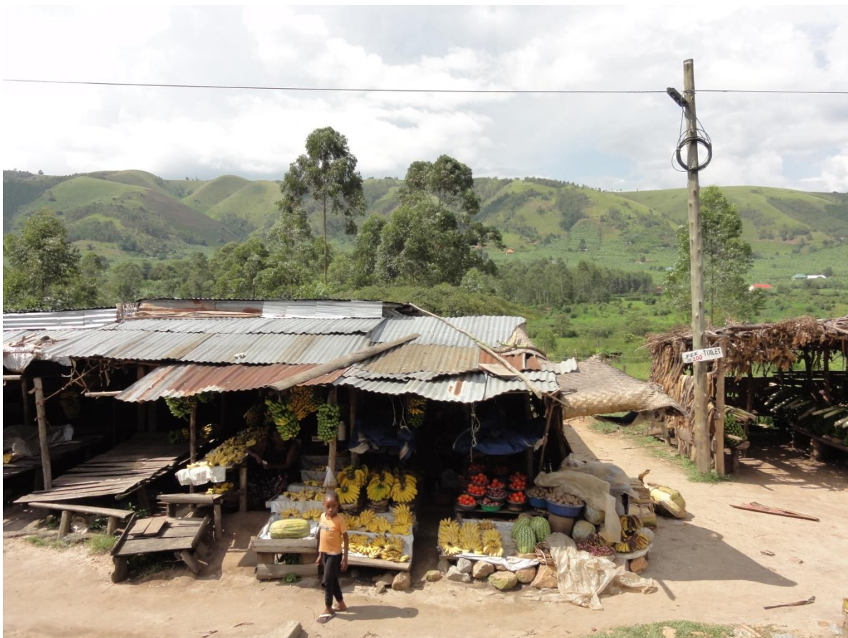
De nombreuses personnes me manqueront, mais aussi les paysages et... les bananes !