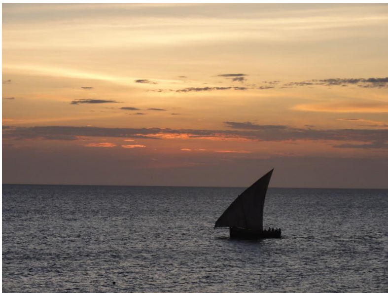
Zanzibar est aussi célèbre pour ses voiliers traditionnels.