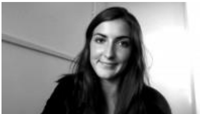
PAR SOPHIE HELLE

Et puis, dans notre réalité à triple vitesse où chaque minute est comptée, pouvons-nous utiliser l'horizontalité ? Ces outils restent-ils pertinents ? Pouvons-nous les répliquer dans une structure verticale, où la direction a le dernier mot ? Tu es attaché-e à l'horizontalité et au consensus. Pas pour les heures de débat que cela implique, certainement pas. Mais finalement, c'est une structure organisationnelle où respect, écoute, ouverture à l'autre et empathie sont de mise. Et toi comme moi, on mérite un environnement quotidien basé sur ces valeurs, qu'il soit horizontal ou vertical. Il nous permet de reconnaître les dynamiques de pouvoir existantes, nos différences, et d'y travailler. Le directeur, la coordinatrice, le stagiaire, toi et moi, on a le droit de grandir, de mûrir. On a le droit d'exister.