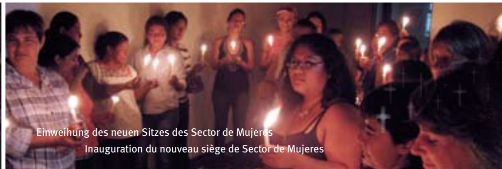
Einweihung des neuen Sitzes des Sector de Mujeres Inauguration du nouveau siège de Sector de Mujeres