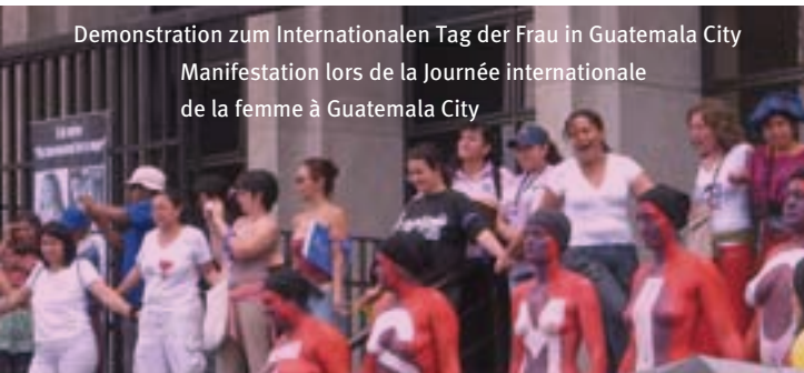
Demonstration zum Internationalen Tag der Frau in Guatemala City Manifestation lors de la Journée internationale de la femme à Guatemala City