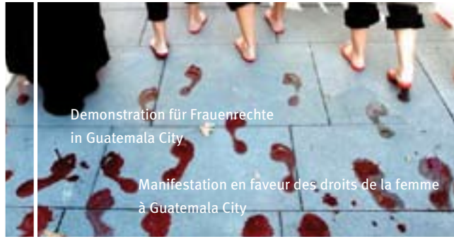
Demonstration für Frauenrechte in Guatemala City