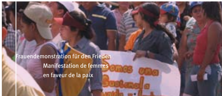
Frauendemonstration für den Frieden Manifestation de femmes en faveur de la paix