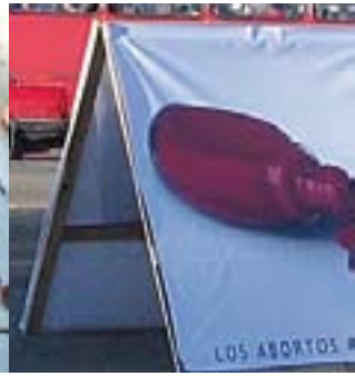
Manifestation en faveur des droits de la femme à Guatemala City

Au Guatemala, l'évolution du féminicide est marquée par deux périodes de forte intensité. Dans les années 80 d'abord, en plein conflit, plus de deux cent mille personnes ont été tuées en huit mois, dont une grande proportion de femmes. Leur exécution était liée à leur engagement politique, militaire, religieux ou en faveur des droits humains. La violence physique et sexuelle était un moyen de répression sélectif contre les femmes leaders, qui représentaient une menace pour le pouvoir en place.