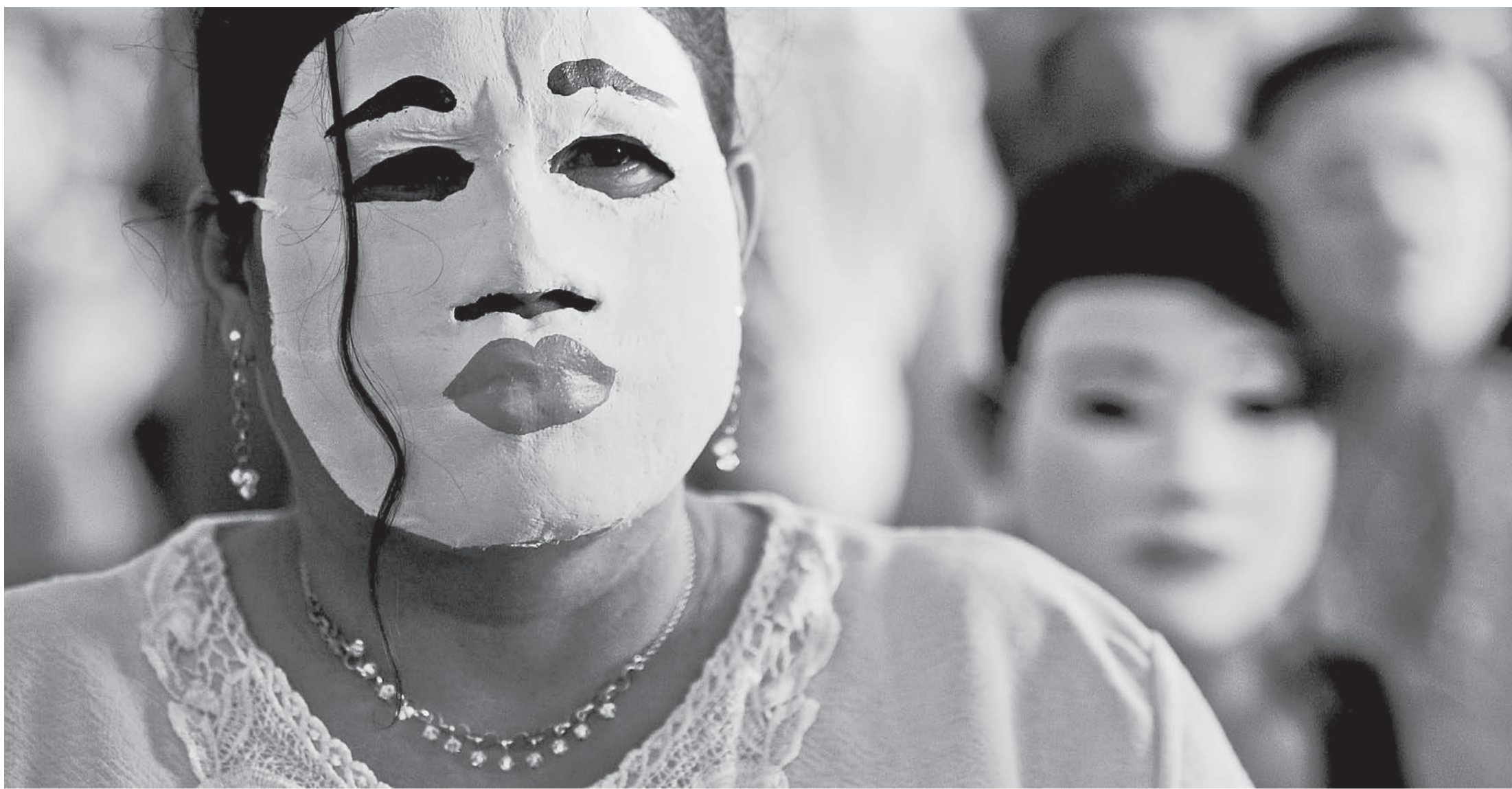
Trauer ist nur eines der Gesichter: Kolumbianische Frauen reagieren auf Gewalt vermehrt mit Selbstorganisation, Solidarität und Widerstand.